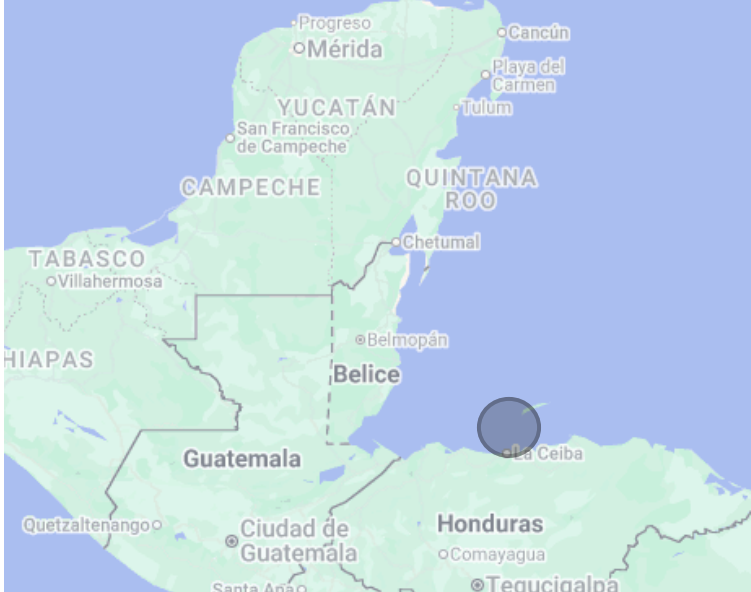
Ubicación de Refugio de Vida Silvestre Barras de Cuero y Salado

El proyecto Fase III representa un esfuerzo conjunto para fortalecer la gestión efectiva de las áreas protegidas costero marinas del Sistema Arrecifal Mesoamericano. Con el aporte financiero de la Cooperación Alemana a través del KfW, y la participación activa de administradores y co-administradores de las APMC, esta iniciativa regional fortalece la protección de ecosistemas estratégicos y contribuye a mantener los beneficios que estos generan para las comunidades.