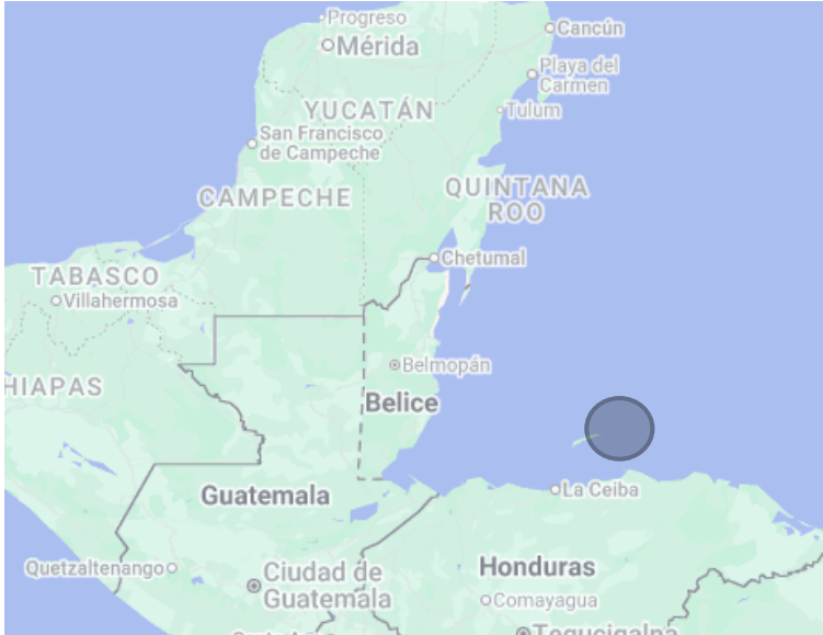
Ubicación de la Zona de Protección Especial Marina Michael Rock

El proyecto Fase III representa un esfuerzo conjunto para fortalecer la gestión efectiva de las áreas protegidas costero marinas del Sistema Arrecifal Mesoamericano. Con el aporte financiero de la Cooperación Alemana a través del KfW, y la participación activa de administradores y co-administradores de las APMC, esta iniciativa regional fortalece la protección de ecosistemas estratégicos y contribuye a mantener los beneficios que estos generan para las comunidades.