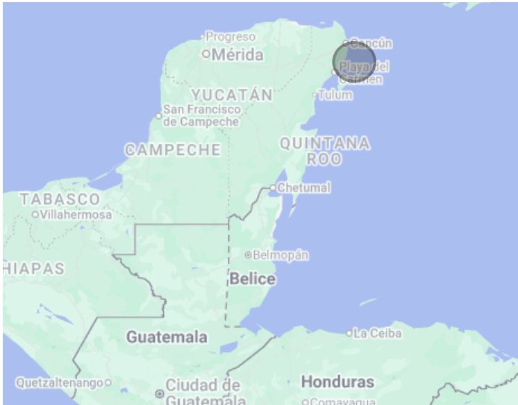
Ubicación del Parque Nacional Arrecife de Puerto Morelos

El proyecto Fase III representa un esfuerzo conjunto para fortalecer la gestión efectiva de las áreas protegidas costero marinas del Sistema Arrecifal Mesoamericano. Con el aporte financiero de la Cooperación Alemana a través del KfW, y la participación activa de administradores y co-administradores de las APMC, esta iniciativa regional fortalece la protección de ecosistemas estratégicos y contribuye a mantener los beneficios que estos generan para las comunidades.