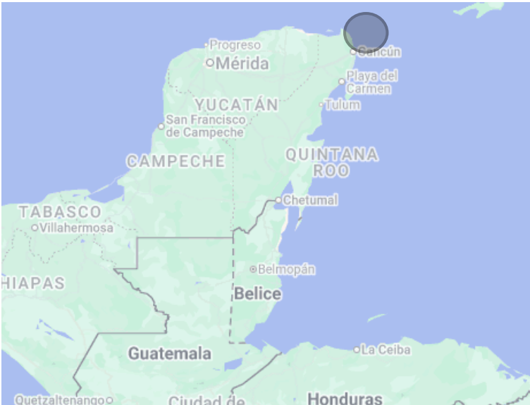
Ubicación de la Isla Contoy

El proyecto Fase III representa un esfuerzo conjunto para fortalecer la gestión efectiva de las áreas protegidas costero marinas del Sistema Arrecifal Mesoamericano. Con el aporte financiero de la Cooperación Alemana a través del KfW, y la participación activa de administradores y co-administradores de las APMC, esta iniciativa regional fortalece la protección de ecosistemas estratégicos y contribuye a mantener los beneficios que estos generan para las comunidades.