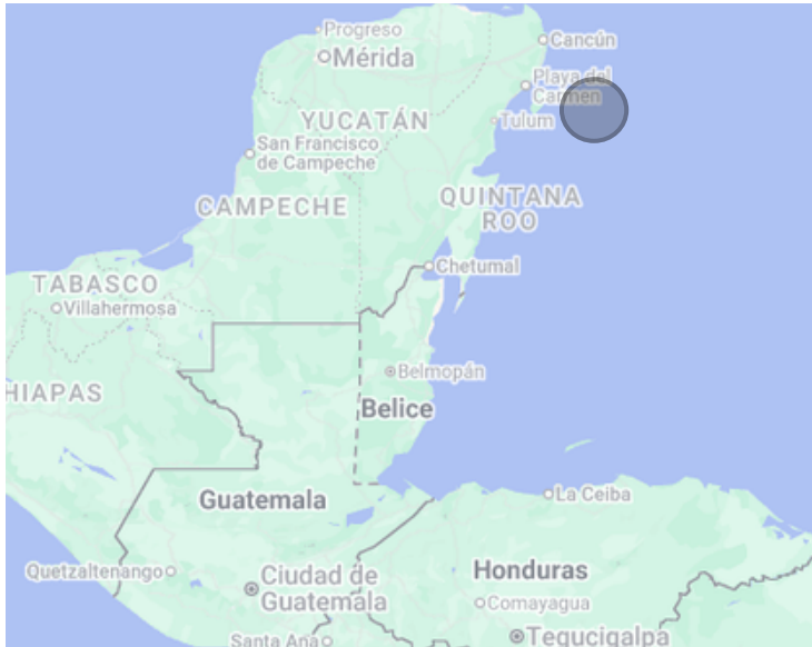
Ubicación de la Isla de Cozumel

El proyecto Fase III representa un esfuerzo conjunto para fortalecer la gestión efectiva de las áreas protegidas costero marinas del Sistema Arrecifal Mesoamericano. Con el aporte financiero de la Cooperación Alemana a través del KfW, y la participación activa de administradores y co-administradores de las APMC, esta iniciativa regional fortalece la protección de ecosistemas estratégicos y contribuye a mantener los beneficios que estos generan para las comunidades.