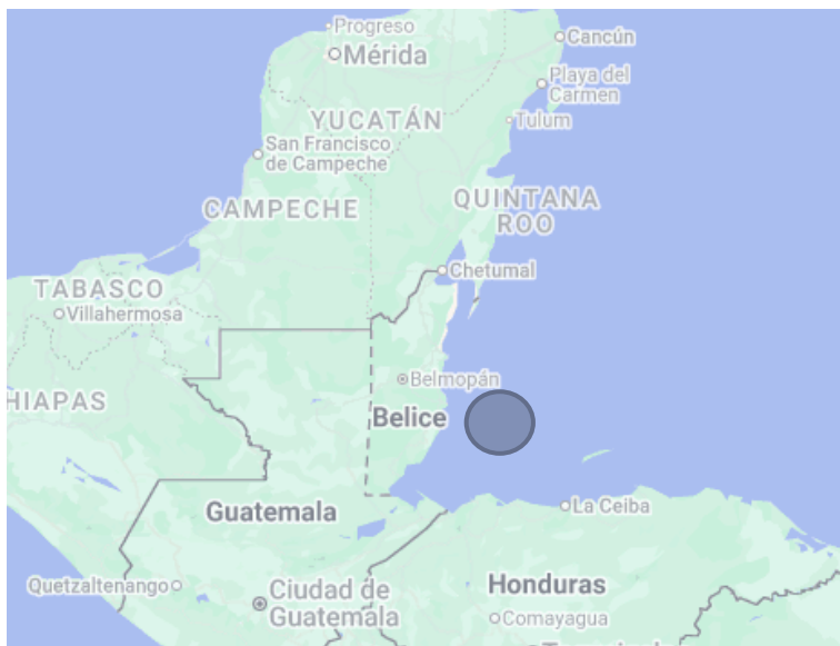
Ubicación de la Reserva Marina Gladden Spit & Silk Cayes

El proyecto Fase III representa un esfuerzo conjunto para fortalecer la gestión efectiva de las áreas protegidas costero marinas del Sistema Arrecifal Mesoamericano. Con el aporte financiero de la Cooperación Alemana a través del KfW, y la participación activa de administradores y co-administradores de las APMC, esta iniciativa regional fortalece la protección de ecosistemas estratégicos y contribuye a mantener los beneficios que estos generan para las comunidades.