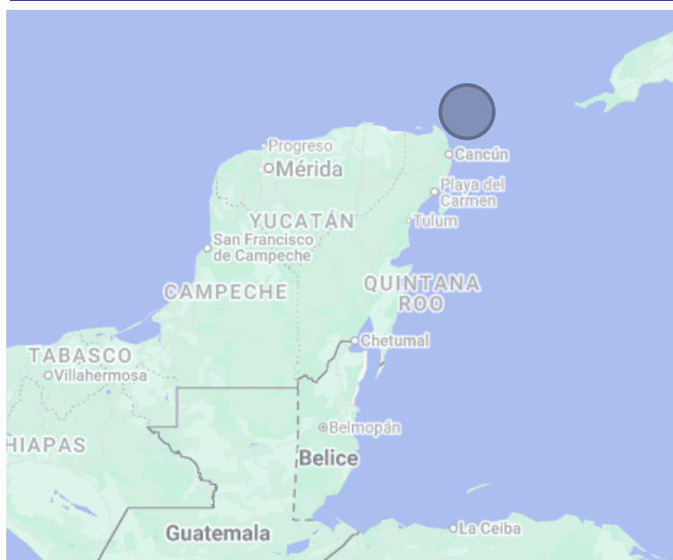
Ubicación de la Isla Contoy