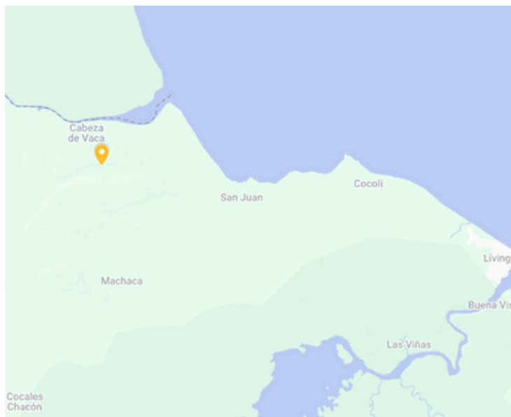
Área de Uso Múltiple Río Sarstún