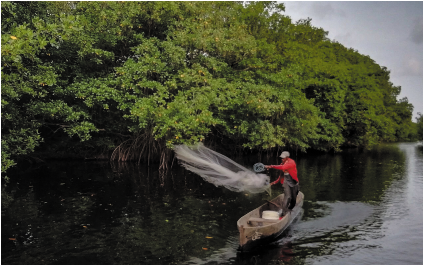
El Pescador Honduras