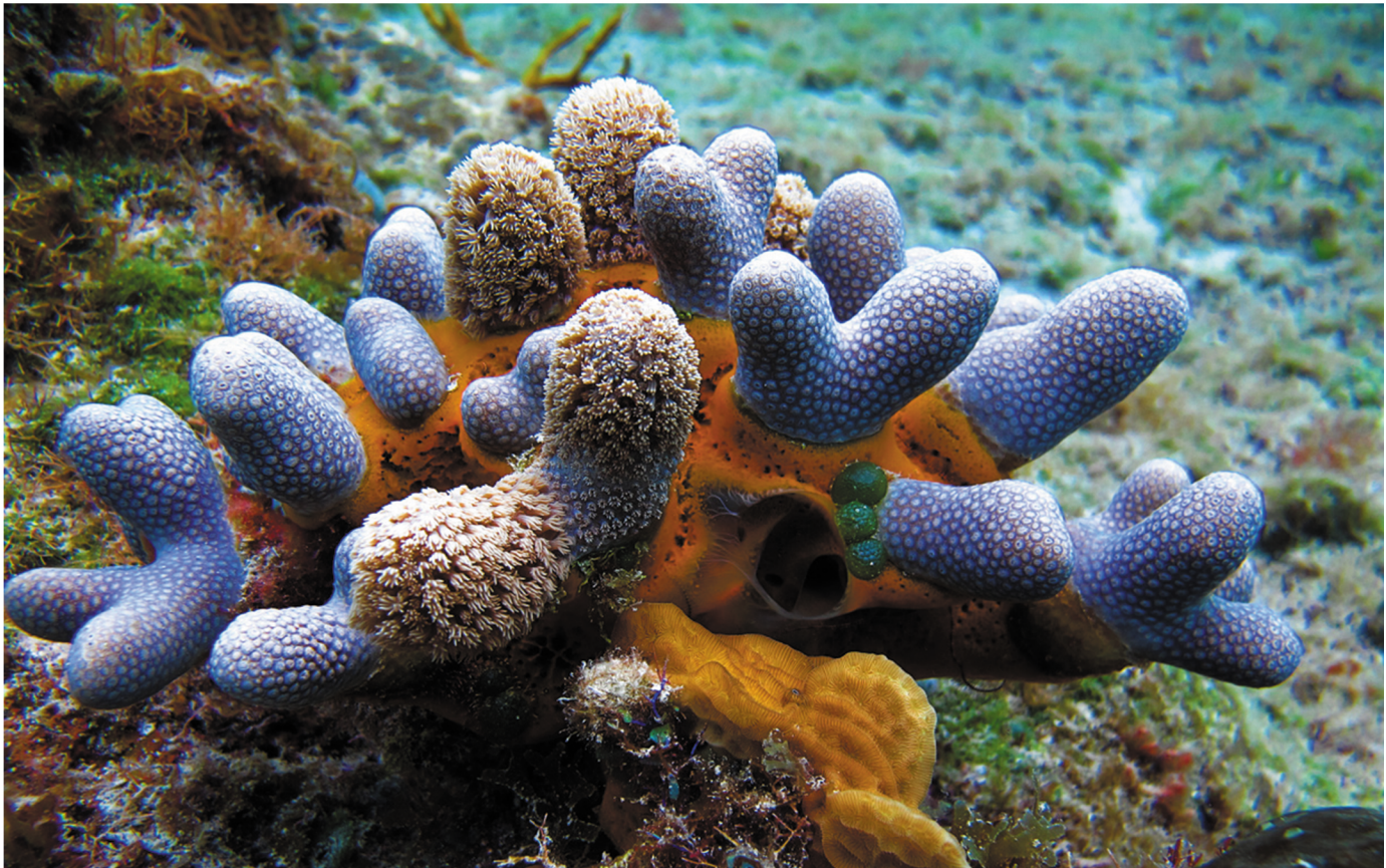
Pólipos de Porites Cozumel, Quintana Roo, México