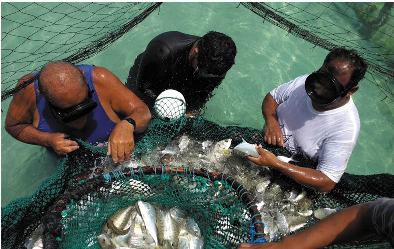
Tres Generaciones, Una META. Forma de vida sostenible Bacalar Chico Marine Reserve, Belice